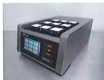
図1：タイムラプスインキュベーター

幅382×奥行591×高さ210mmと、従来の機器に対して、大幅に小型化しました。設置場所に余裕のないクリニックでも導入しやすく、2台を重ねて設置することも可能です。