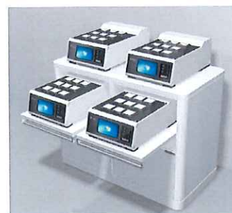
図2：2台重ねた設置応用例