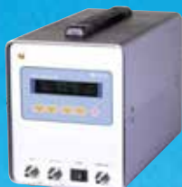
標準ガスアナライザー AGA-2008

インキュベーター専用のガス濃度 アナライザー。充電式バッテリー 内蔵でCO 2 /O 2 ガス濃度両方に対応。 外形寸法 W150×D280×H187mm 製品質量 4.5Kg 電源 AC100V1A