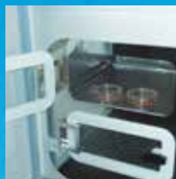
ガラス小扉セット GAW-30DHS

インキュベーターを架台に 固定できます。 30シリーズ用 AP30STD 寸法a560×b440×c900× d345×e530mm