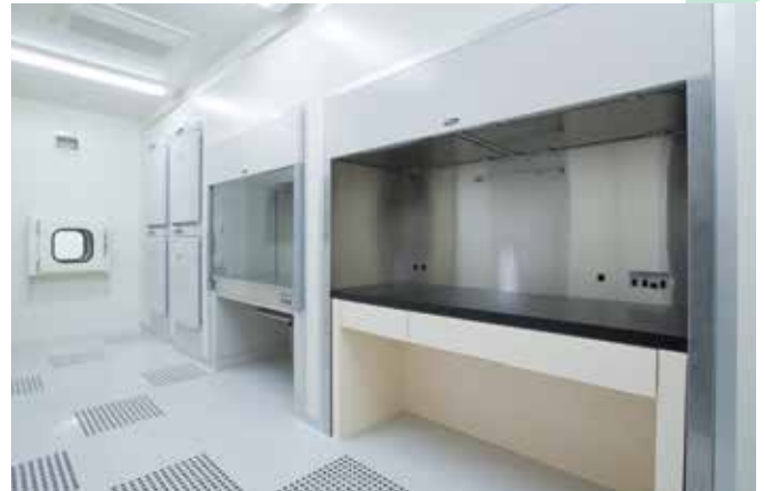
器材を壁に埋め込み気流の障害をできるだけ無くしました