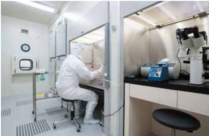
弊社細胞科学研究所での作業風景