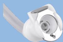
専用コネクター VFAS-CNC02 (2個)