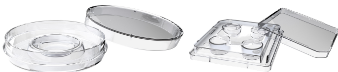
Center Well Dish