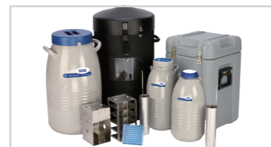
CXシリーズ 試料運搬用容器 ※3年間真空保証