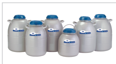
HC/TWシリーズ 多量試料保存用容器 ※5年間真空保証