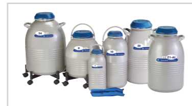
XT/XTL/TWシリーズ 長期保存用容器 ※5年間真空保証