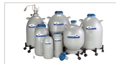
LDシリーズ 液体窒素運搬用容器 ※5年間真空保証