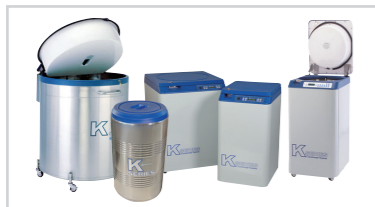
Kシリーズ 大量試料保存用容器 ※3年間真空保証