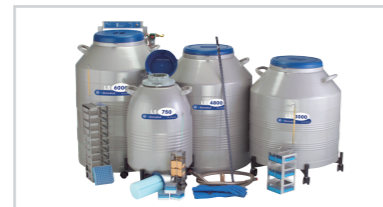
LSシリーズ ラック式凍結保存容器 ※3年間真空保証